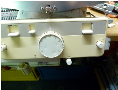
für 1 rechts/1 links

Am Hauptbettschlitten werden keinerlei Tasten gedrückt, die Maschenweite 4 Am Doppelbettschlitten wie auf den Bildern (auch Maschenweite 4):